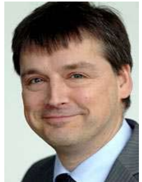
Kajo Wasserhövel

Zum einen die Ergebnisse: Im März 2005 waren über 5 Millionen Menschen in Deutschland arbeitslos. Wir sind jetzt unter drei Millionen. Immer noch zu viele aber wir sind doch vorangekommen! Das alte System hat hunderttausende Menschen nicht angesprochen und war nicht darauf ausgerichtet, allen Brücken in Arbeit zu bauen. Natürlich ist nicht alles schon in Ordnung. Wir haben beispielsweise Probleme im Bereich der Zeitarbeit - die müssen wir jetzt angehen. Aber die alte Arbeitsmarktpolitik war nicht die gute alte Zeit. Jahr für Jahr wurde mehr ausgegeben - und zahlen müssen das die Arbeitnehmerinnen und Arbeitnehmer mit ihren Steuern und Abgaben - und nach jeder Krise waren es mehr Langzeitarbeitslose. Das konnten wir so nicht weitermachen. Jetzt brau-